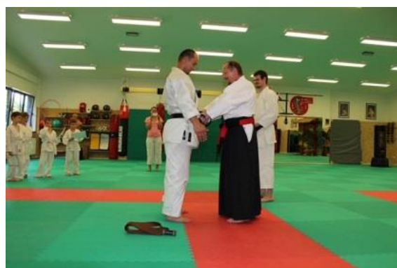
První uvázání pásu - předsedou zkušební komise