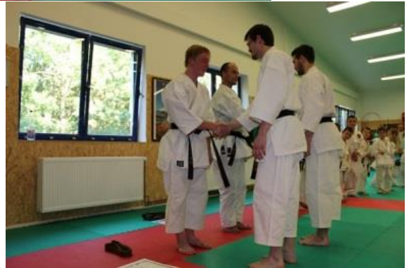
A také první gratulace mezi sebou