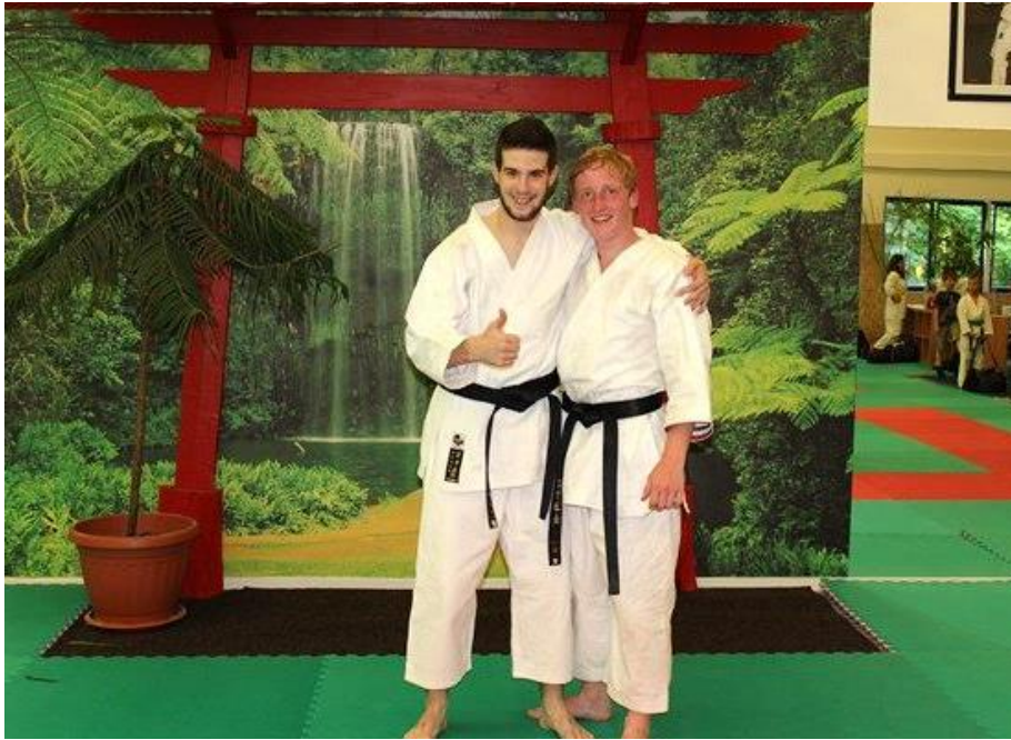
Gratulace od Kuby - pod jezerní bránou v dójo Čech Akademy Black Belt