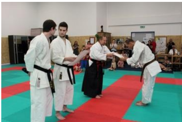
Certifikát o komisním složení zkoušky