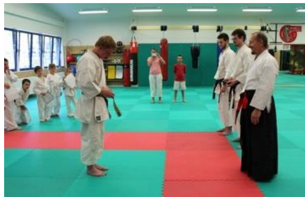
Odvázání žákovského obi