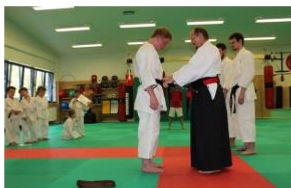
První uvázání black beltu