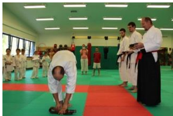
Odložení hnědého pásu