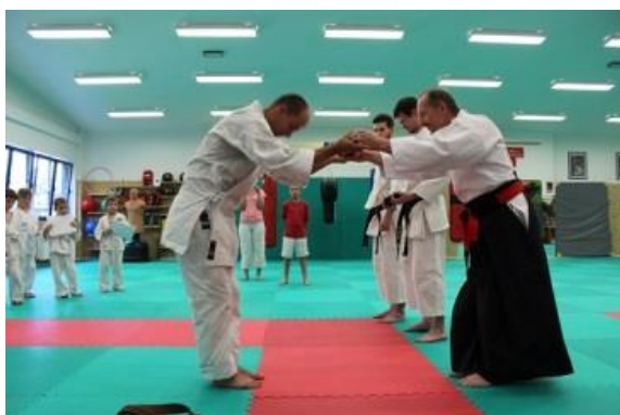
Převzetí černého obi