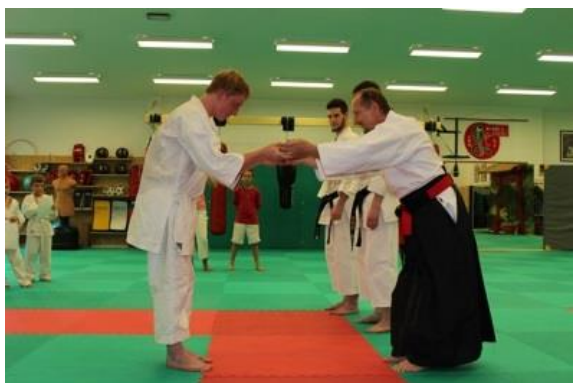
Symbolické převzetí mistrovského pásu