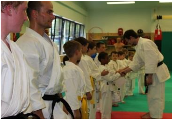
Gratulace pro všechny, kteří zkoušku udělali od ostatních členů zkušební komise.